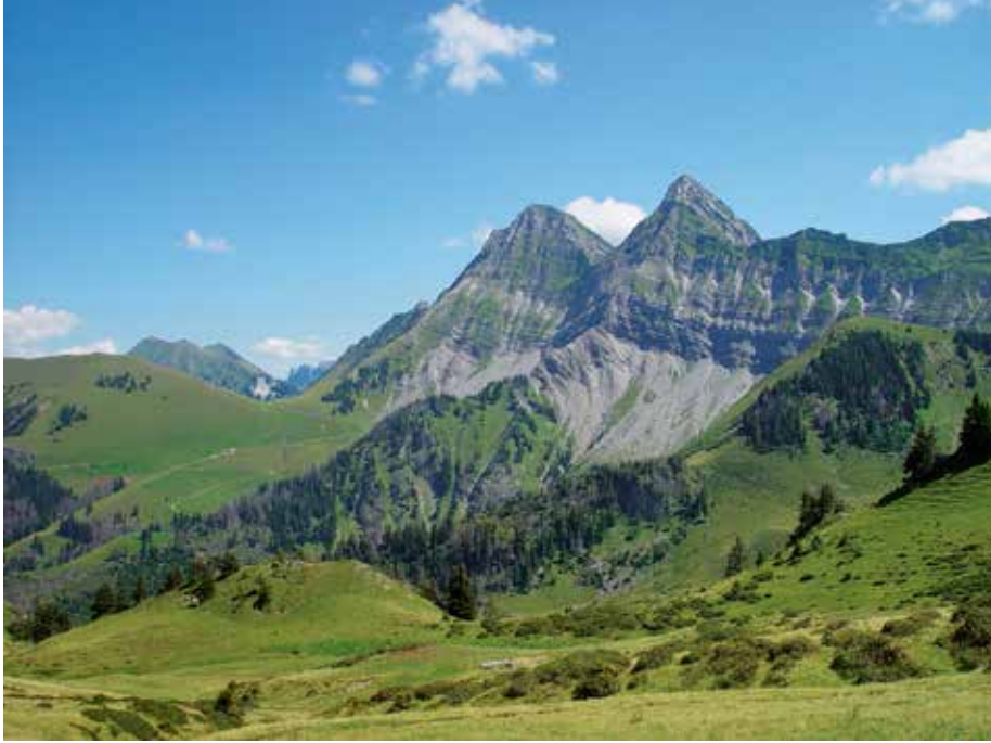
Les populations les plus importantes de sabline bernoise se trouvent dans le canton de Fribourg, en partie dans le complexe du Vanil Noir: Dent de Brenleire (à gauche) et Dent de Folliéran (à droite).

Die wichtigsten Populationen des Berner Sandkrauts befinden sich im Kanton Freiburg. Hier wächst es in der Kette des Vanil Noir auf dem Dent de Brenleire (links) und dem Dent de Folliéran (rechts).