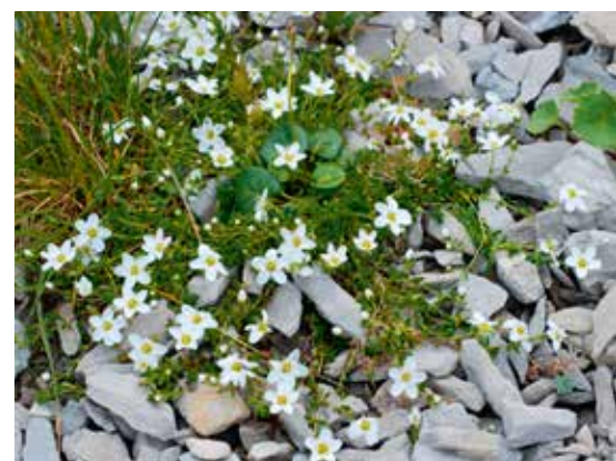
Arenaria bernensis se distingue d' A. ciliata s.str. par un port général plus lâche et des tiges plus longues. Plusieurs fleurs irrégulières à 6 pétales peuvent être observées sur cette image (Kaiseregg, FR).

Ein weiteres typisches Merkmal von Arenaria bernensis sind die unregelmässigen Blüten. Dabei können bis zu 9 Blütenblätter und 16 Staubblätter vorhanden sein (Leiterenpass, BE).