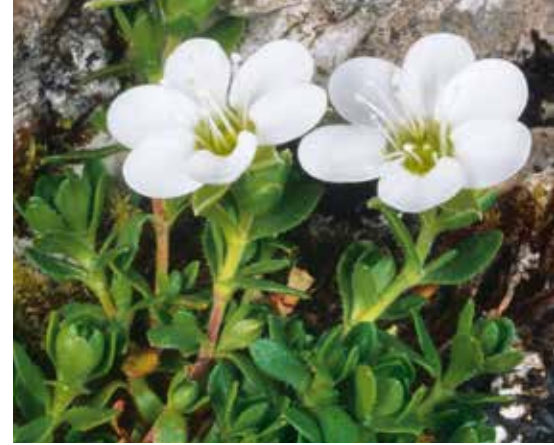
Arenaria bernensis possède de larges fleurs solitaires ou rarement géminées, au contraire d' A. multicaulis qui peut compter jusqu'à 7 fleurs par rameaux (col de la Leiteren, BE).