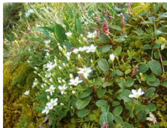
Arenaria bernensis pousse presque uniquement au-dessus de 2000 m d'altitude, dans les endroits frais et exposés au nord. Elle est souvent accompagnée de Salix reticulata.

Das Verbreitungsgebiet von A. bernensis erstreckt sich über ca. 40 km entlang der nördlichsten Voralpengipfel, vom Vanil Noir-Massiv (FR) bis zum Stockhorn (BE). Da die Pflanze fast nur über 2'000 m ü. M. wächst, besteht ihr Areal aus wenigen isolierten Gipfelinseln (Vanil Noir, Schopfenspitze, Kaiseregg, Gantrisch und Stockhorn). Trotz des kleinen Verbreitungsgebiets, scheint A. bernensis mittelfristig nicht vom Aussterben bedroht zu sein. Abgesehen vom Stockhorn sind die meisten Gipfel der Berner und Freiburger Voralpen vom Massentourismus und anderen menschlichen Aktivitäten noch wenig betroffen. In Folge des Klimawandels, könnte der Gipfelspezialist A. bernensis in Zukunft jedoch zu den Hauptkandidaten für ein Aussterben zählen. Aus diesem Grund verdient A. bernensis sowohl von der Forschungs-, als auch von der Artenschutzseite weiterhin Aufmerksamkeit.