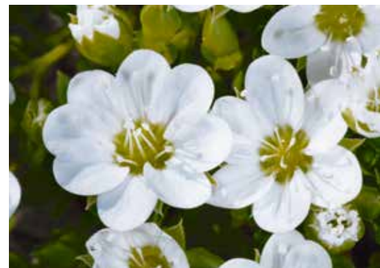
Une caractéristique typique d' Arenaria bernensis est la présence de fleurs irrégulières, pouvant compter jusqu'à 9 pétales et 16 étamines (col de la Leiteren, BE).

Charakteristisch für Arenaria bernensis sind die meist einzeln stehenden Blüten (selten 2 Blüten pro Zweig). Dies unterscheidet die Art von A. multicaulis , welche bis 7 Blüten pro Zweig aufweisen kann (Leiterenpass, BE).