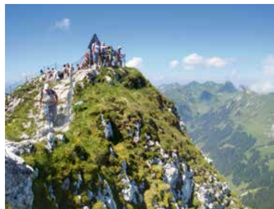
La grande majorité des populations d' Arenaria bernensis ne subissent pas de menaces à court ou moyen termes. La seule atteinte directe envers la sabline bernoise, réside dans le piétinement important des marcheurs et des touristes sur certaines populations établies sur les sommets (ici au Stockhorn).

Arenaria bernensis gedeiht fast ausschließlich in kühlen, nördlich exponierten Hängen oberhalb von 2000 m Höhe. Dabei wird sie oft von Salix reticulata begleitet.